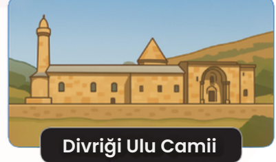
Divriği Ulu Camii

Bu bilgilerden hareketle ilk dönem Türk beylikleri ile ilgili hangi çıkarımlar yapılabilir? Yazınız. (10 P.)